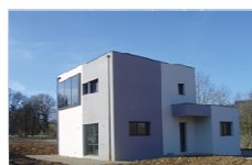
Maison Individuelle Cequami NF Maison Individuelle Mention BBC-Effinergie (12)