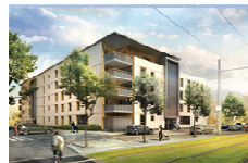
Collectif de 36 logements En cours de certification Cerqual Qualitel Mention BBC-Effinergie (38)