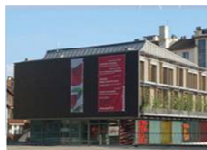
Tertiaire de 700 m 2 Shon Certivéa NF Bâtiments Tertiaires Démarche HQE mention BBC-Effinergie (74)