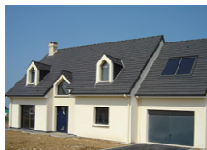
Maison Individuelle Promotelec Label Performance mention BBC-Effinergie (76)