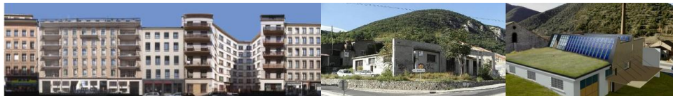
9 logements dans le centre de Lyon Bureaux à Sirach (Languedoc-Roussillon)