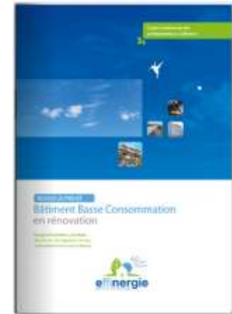
Le Guide Rénovation