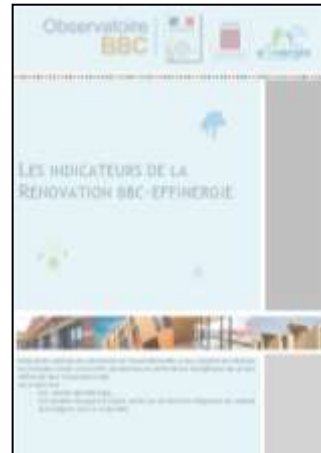
Des études, newsletters