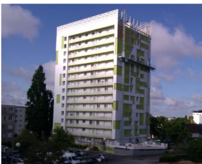
Rénovation - Résidence Marie Stuart Tour T - Maître d'ouvrage : Les Résidences de l'Orléanais

rénovation ou Effinergie rénovation. Les autres opérations sont en cours de travaux.