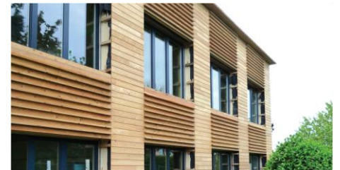
Rénovation groupe scolaire - Dardilly – Source : Observatoire BBC – Tekhnè Architecte

L'étude porte sur 364 bâtiments résidentiels, dont 247 bâtiments collectifs (84% de logements sociaux), certifiés BBC-Effinergie rénovation ou Effinergie rénovation. 92% des logements individuels étudiés sont des maisons en secteur diffus.