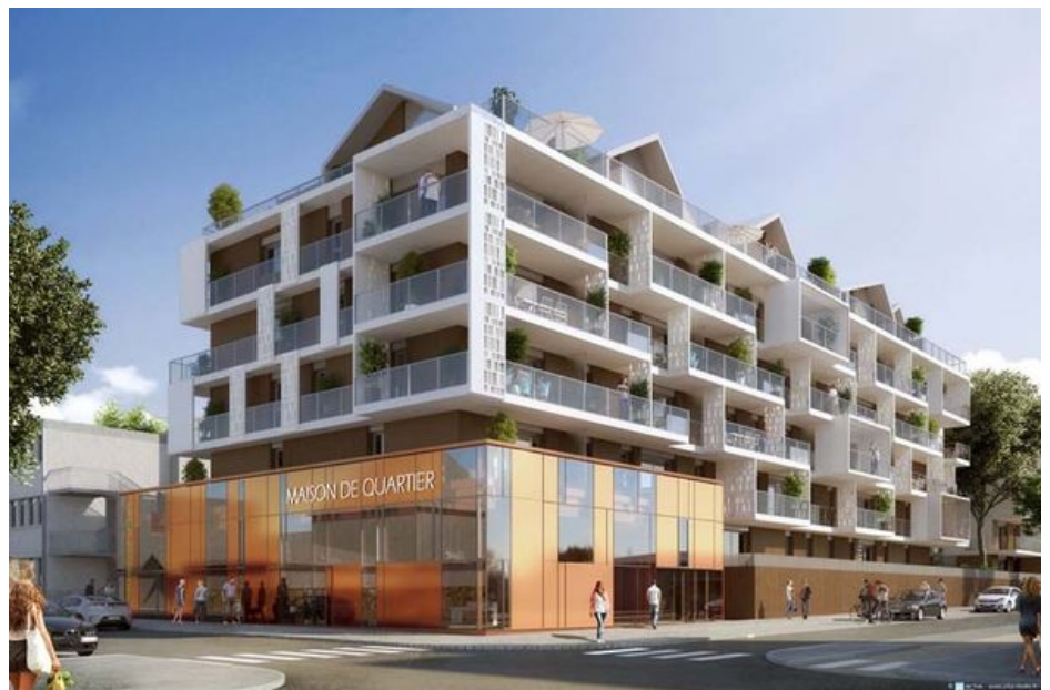
Logements collectifs : la résidence Le Sundeck est un projet Bepos Effinergie 2017 (E3C1).

- Les méthodes de calculs sont floues et les marges